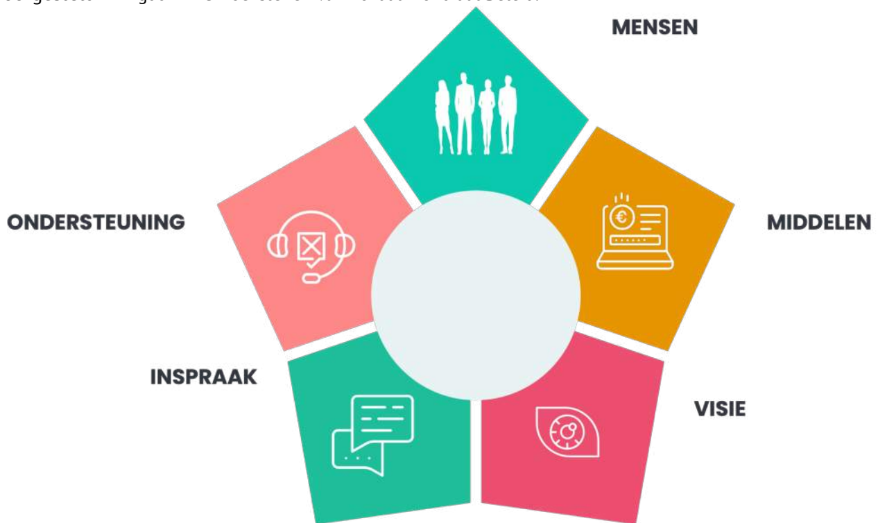
Figuur 4 - 5 hoekstenen van Lokaal Mondiaal Beleid

Wij hebben volgende aanbevelingen voor het toekomstig bestuur, en dit rond 5 hoekstenen zoals voorgesteld in Figuur 4 - 5 hoekstenen van Lokaal Mondiaal Beleid.