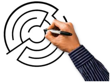
Figuur 3

Het startpunt van dat beleid is het opstellen van een gemotiveerde beleidsnota over internationale solidariteit en het aanstellen van een schepen van internationale solidariteit in de gemeente. Maar het vraagt ook een significant budget en het voorzien van specifieke ambtelijke ondersteuning. De gemeente heeft bovendien ook de taak om participatie, inspraak en advies door burgers en verenigingen uit het middenveld te organiseren.