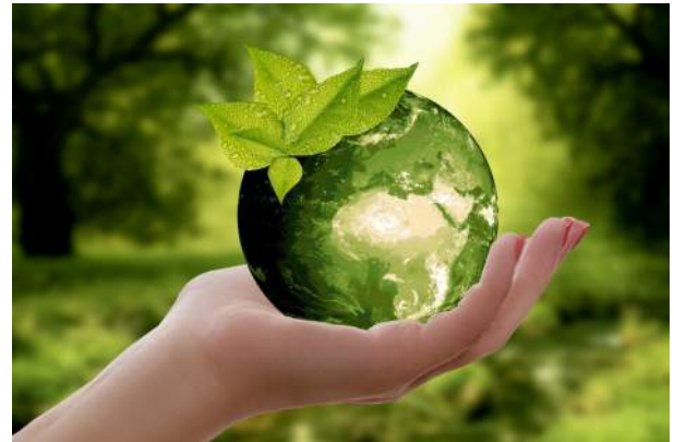
Figuur 6 - Annette, Pixabay

Vaak verdwijnt de mondiale dimensie van de klimaatuitdaging uit het beeld. Gemeenten meten hun beleid af aan de hand van de resultaten die ze binnen de gemeentegrenzen realiseren. Maar het klimaatonrecht verbindt bij uitstek het lokale en het mondiale. Het is daarom de opdracht van het lokale mondiale beleid om die globale dimensie in beeld te houden. <Bijvoorbeeld door burgers te sensibiliseren over internationale klimaatonrechtvaardigheid.